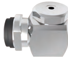
标准喷头 / 中小流量