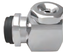
标准喷头 / 中小流量