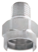
KJJ 和 KJJL 外螺纹主体