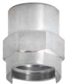
KJ 和 KJL 内螺纹主体或